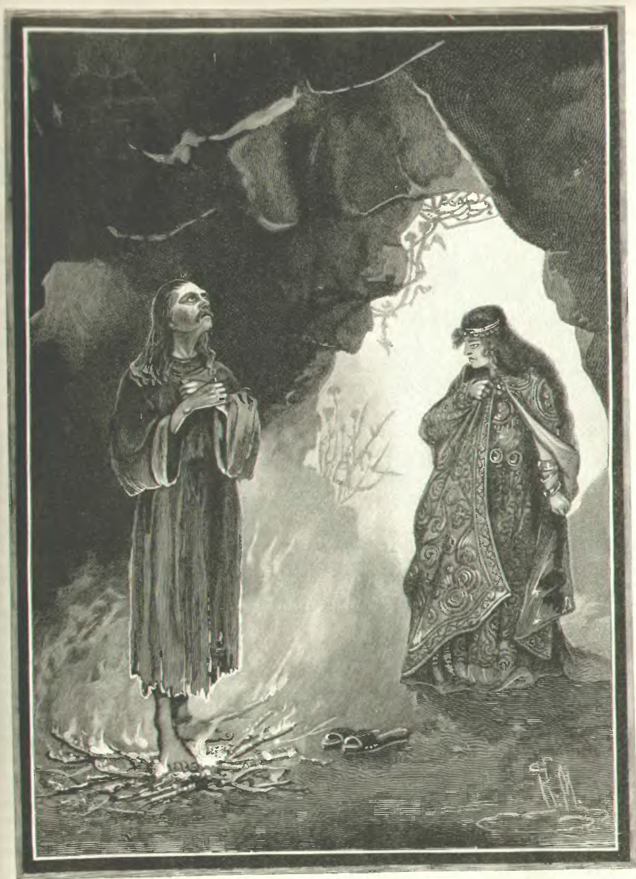
Преподобный Мартинианъ и Зоя. (Память 13 февраля.— Въ стр. 100—108).