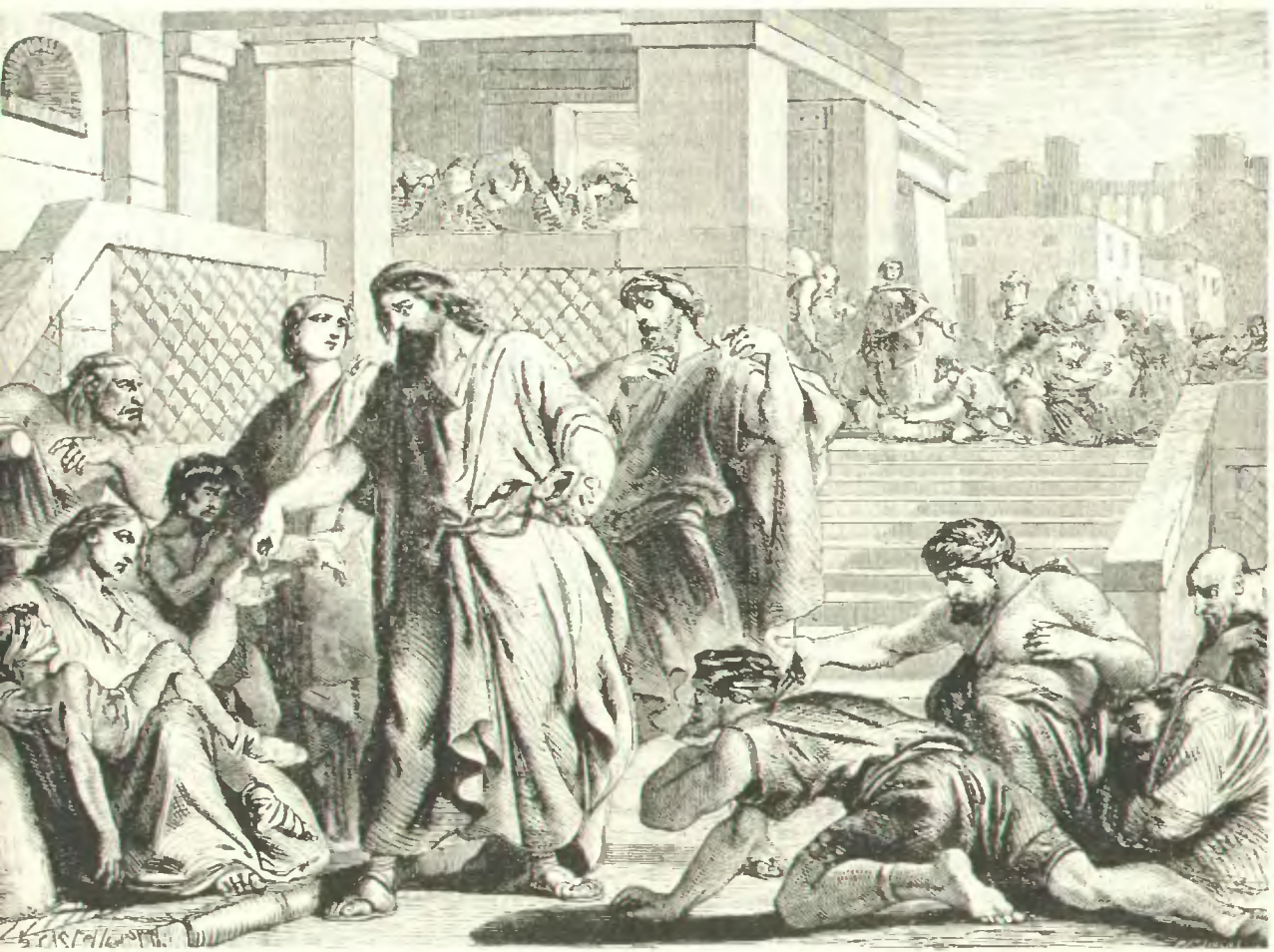
Библія въ картинахъ. — «Отверзай руку твою нищему» (Второзак. XV. 11). (Къ статьѣ: „Комфортъ души“).

Подписка принимается въ главной конторѣ „Русскаго Паломника“ — С.-Петербургъ, Стрѣмянная, № 12, собств. домъ. Городские обращаются въ отопленіе конторы: Невскій просп., д. № 96, улозъ Надеждинскій. Каждый новый подписчикъ получаетъ въ уже вышедшіе въ 1906 году номера журналъ со всеми приложеніями. За перемѣну адреса городского на иногородній, или иногородняго на городскій, взымается 50 коп., — городскою на городскій или иногородняго на иногородній — 20 к. Необходимо прилагать прежній печатный адресъ. „Русскій Паломникъ“ одобренъ всѣми вѣдомствами.