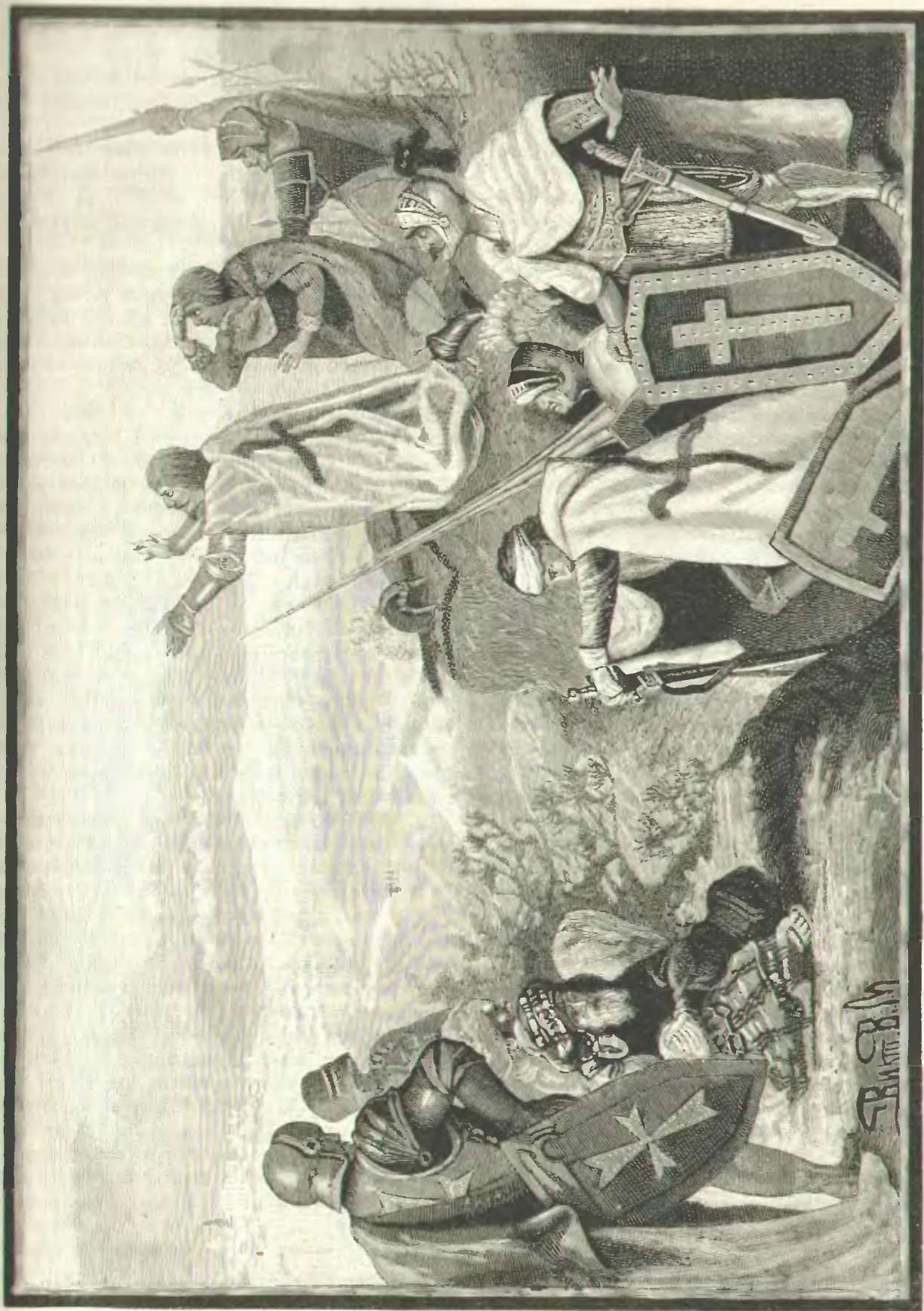
КРЕСТНОСИЦЫ ПЕРЕДЪ ІЕРУСАЛІМОМЪ. (Рисунки Викторина.—Къ статье: «Гайкъ, хощеть Бога!»)