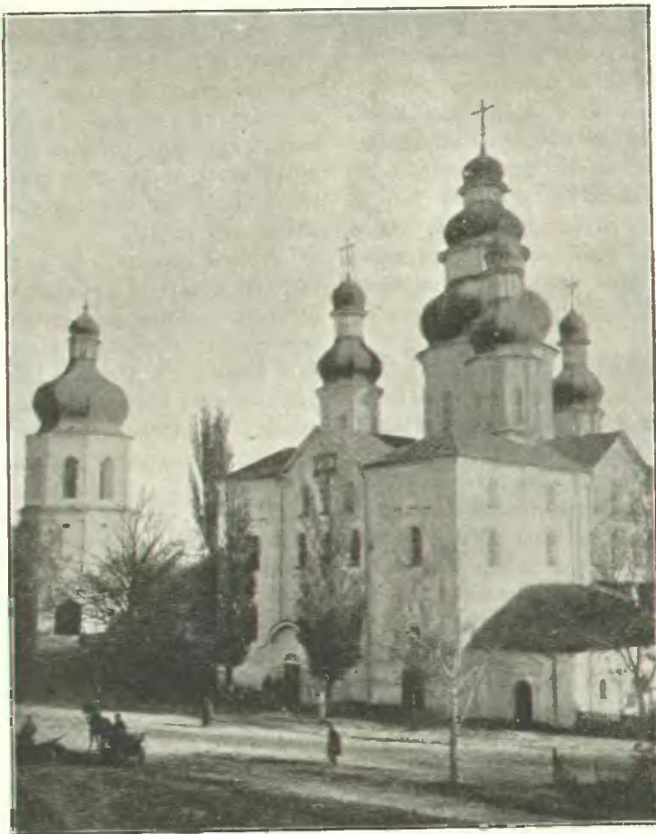
По святымъ мѣстамъ. — Черниговскій Елецкій монастырь.

Видъ съ высоты монастырской колокольни на раскинувшійся внизу Черниговъ, на Троицкія горы, на синюю ленту Десны и на зеленые дуга по ту сторону рѣки полонъ тихой прелести и невозмутимаго покоя. Чѣмъ-то давно забытымъ, далекимъ вѣетъ отъ этой панорамы, и становится понятнымъ, почему преподобный „Антоній, пришедъкъ Чернигову, возлюбилъ Болдины горы и, ископавъ пещеру, ту ся всели“. Миръ и тишина Елецкой обители нарушается только звонкимъ пѣніемъ птицъ въ густыхъ деревьяхъ монастырскаго сада да отдѣльнымъ шумомъ городской жизни. Количество инокъ въ